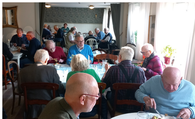
Efter årsmötet samlades deltagarna för förtäring på Dahlbergs Café.